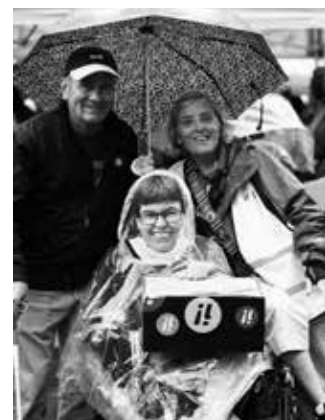
Über 1'300 Menschen haben auf dem Bundesplatz für die Gleichberechtigung von Menschen mit Behinderungen dem Regen getrotzt.