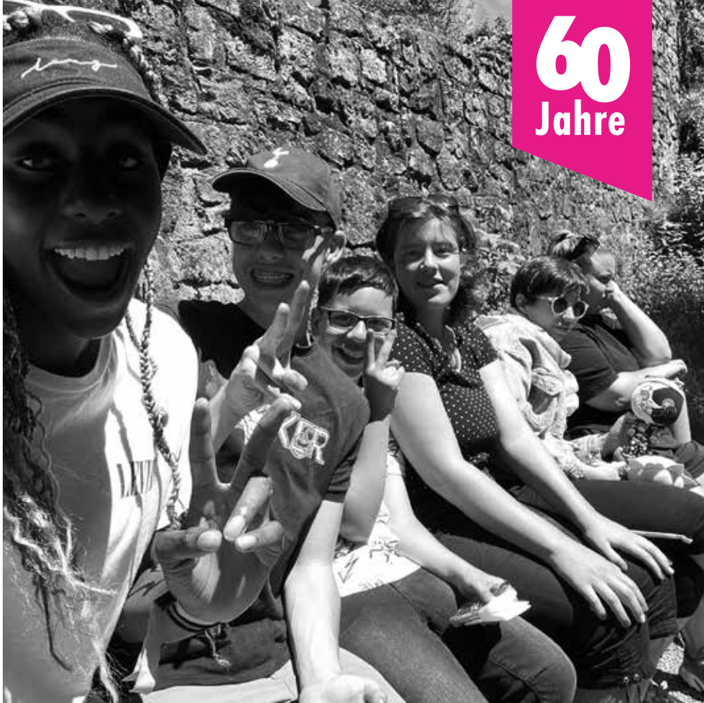
Gute Laune: im Jugendsommerlager.