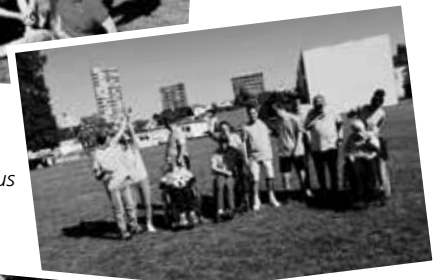
Team Dr. Augustin-Haus