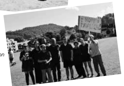
Team le Pavillon