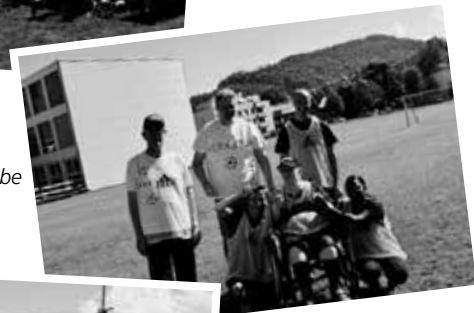
Team Kästeli Werkstube